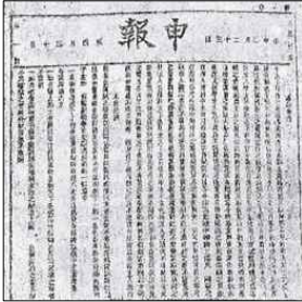
상하이 신보(1872 ~ 1949)