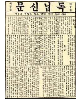
독립신문(1896 ~ 1899)