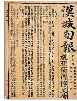
한성순보(1883 ~ 1884)