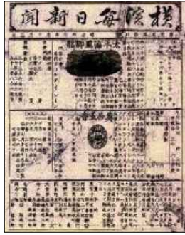
요코하마 마이니치 신문(1870)